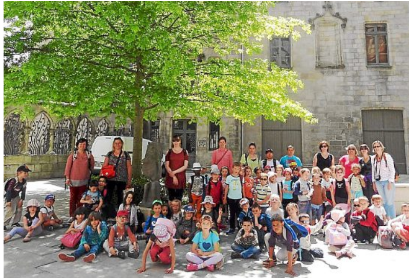
Le groupe a passé une belle journée à Quimper.