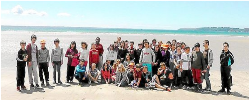
Les élèves ont bien profité de ce séjour.

Du 26 au 28 mai, les élèves des classes de CM1-CM2 et de CM2 de l'école du Bourg de Plouzané sont allés dans la presqu'île de Crozon pour un séjour au centre nautique de Telgruc-sur-Mer. Le programme était copieux avec du char à voile, du tir à l'arc, du surf, du wave-ski et de l'esca-