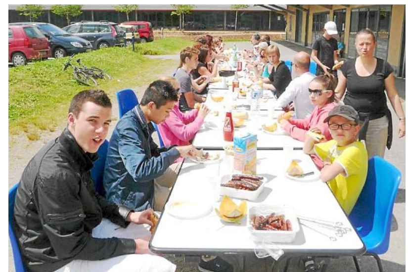
Un moment très sympathique pour terminer la saison au Badagouesnou.

Les adultes et les jeunes désirant découvrir le badminton peuvent ve-