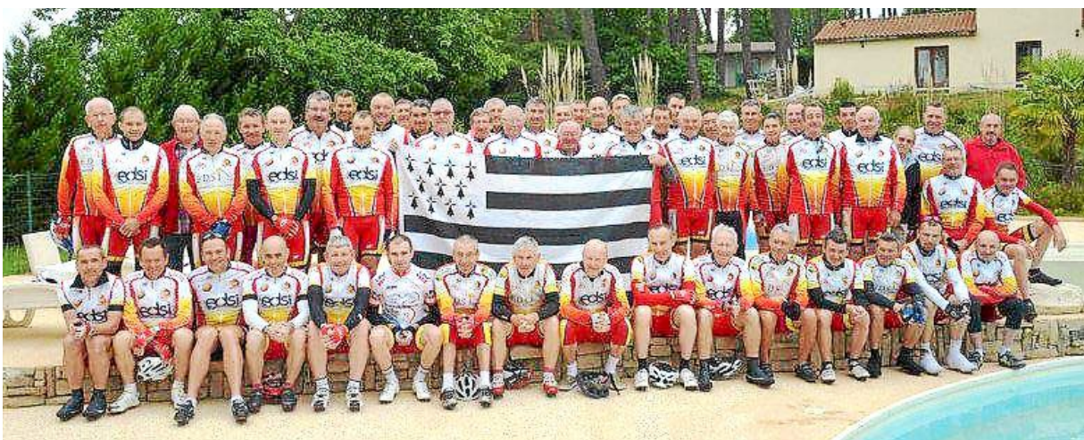
Les cyclistes de Gouesnou étaient nombreux à arpenter les routes de la Dordogne.

Cinquante-sept adhérents de l'Amicale cycliste ont quitté Gouesnou il y a une semaine pour une randonnée de huit jours en Dordogne. Ils ont parcouru durant ce séjour entre 600 et 800 km.