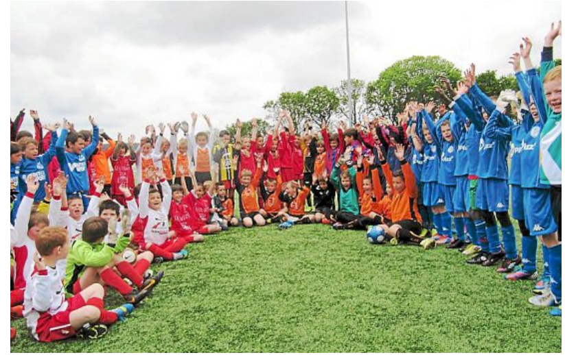
Les jeunes footballeurs avant le début des rencontres.

Sur deux journées, le challenge Rivoallon, organisé par la section football de l'amicale laïque Coataudon (ALC) a vu la participation de 80 équipes, soit 800 jeunes sportifs passionnés du ballon rond, au complexe sportif de Kerlaurent.