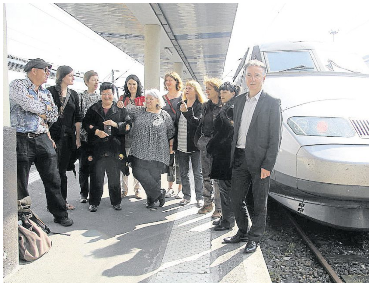
Symboliquement, et pour remercier la SNCF de sa participation financière, les partenaires ont présenté la programmation du festival à bord d'un TGV.

Vendredi 14, samedi 15 et dimanche 16 juin , au Fourneau, port de commerce, et au Parc à Chaînes. Les expositions et ateliers dans les bibliothèques ont démarré et seront visibles jusqu'au 29 juin. Accès au programme complet sur www.ici-ailleurs.net .