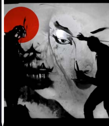
Mic Mac Factory