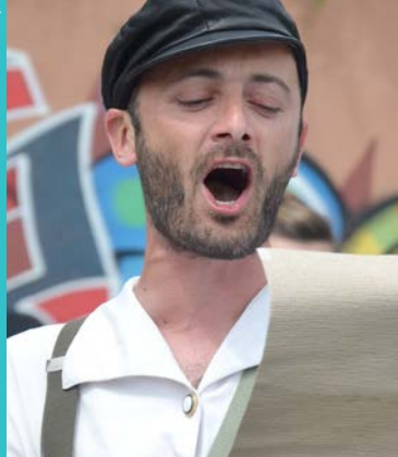
Crieur de rue