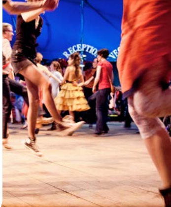
Collectif Mobil Casbah