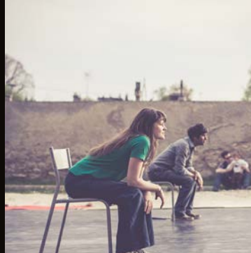
La débordante compagnie