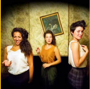
Les Divas Dugazon