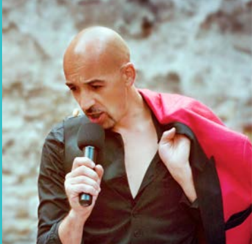
Cie Les Dècatologuès