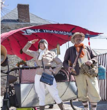
Collectif Le criporteur