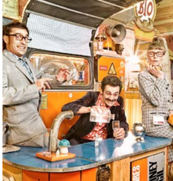
Les établissements BAM