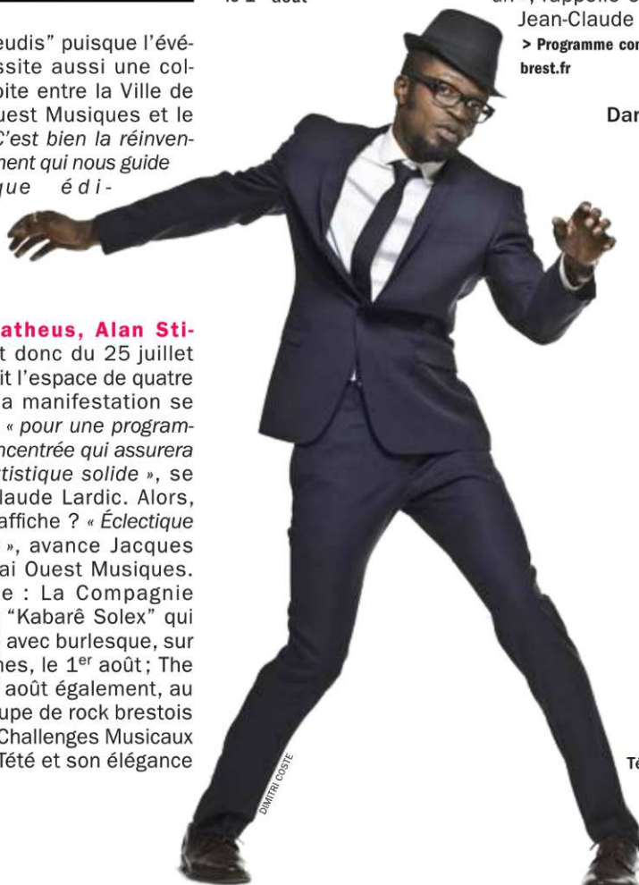
Tété, le 8 août