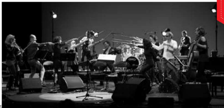
Ensemble Matheus, le 1 er août

Cet été, les Jeudis du Port reprennent date, et pour la 25 e année, s'il vous plaît ! Du 25 juillet au 15 août, le port de commerce va naviguer entre arts de la rue et concerts avec, pour mots d'ordre, fête, convivialité, ambiance intergénérationnels... et sacrées têtes d'affiche !