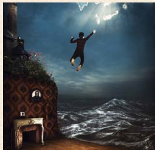
Visuel Laurence Guemec

Un voyage émotionnel et décalé qui chamboule bien des problématiques de notre temps, avec humour et beaucoup d'espoir.