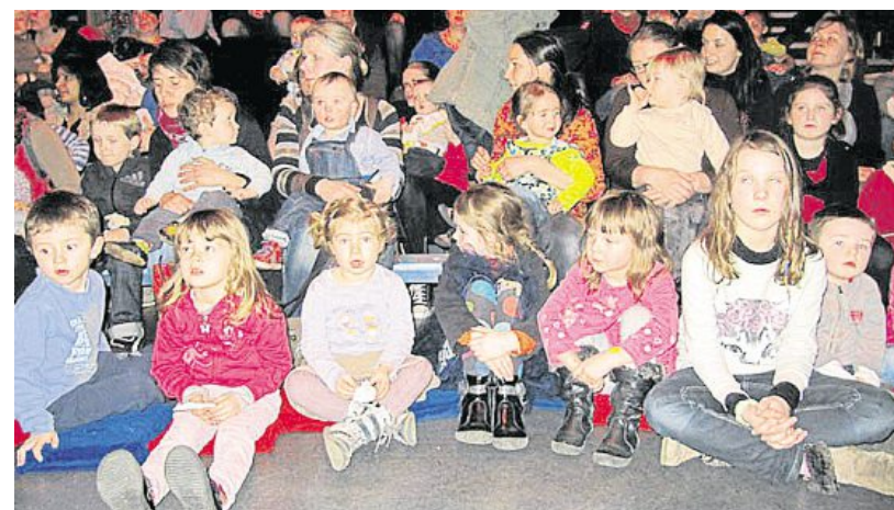
La maison de l'enfance a accueilli, vendredi, Bramborry.

Vendredi, en fin d'après midi, le théâtre de la Guimbarde avait investi la Maison de l'enfance pour y présenter son spectacle Bramborry . Le jeune public a été séduit par ce subtil cache-cache musical qui met en scène trois saxophonistes espiègles. Les musiciens acteurs donnent vie