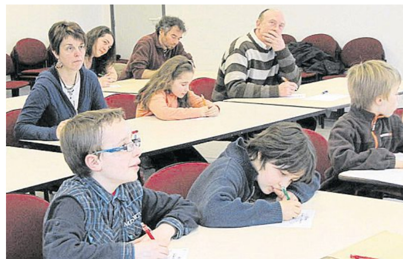
Bien que l'ambiance fût décontractée, les candidats étaient fort appliqués !

Samedi après-midi, à la pépinière des entreprises, se déroulait, comme dans une quinzaine d'autres villes, une épreuve qualificative d'Ar Skrivadeg, concours de dictée en breton. Et ils étaient treize, de tous âges, à avoir choisi de se débattre, avec les subtilités de l'orthographe bretonne. Les candidats se répartissent en cinq catégories, suivant les niveaux scolaires pour les plus jeunes et en débutants et confirmés pour les adultes. « Le breton est surtout parlé, l'objectif est de développer l'écrit auprès