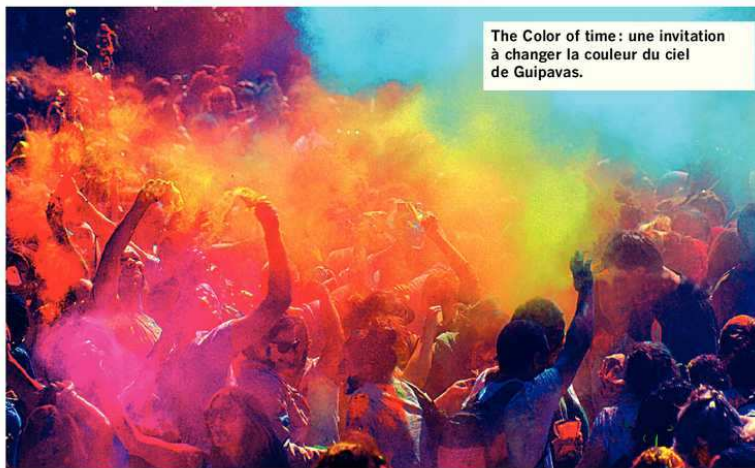
The Color of time: une invitation à changer la couleur du ciel de Guipavas.

Une boum pour enfants, animée par un DJ de la discothèque locale La Villa, est également prévue entre 17 et 18 h et pour les adultes, la compagnie guipavasienne, le Théâtre