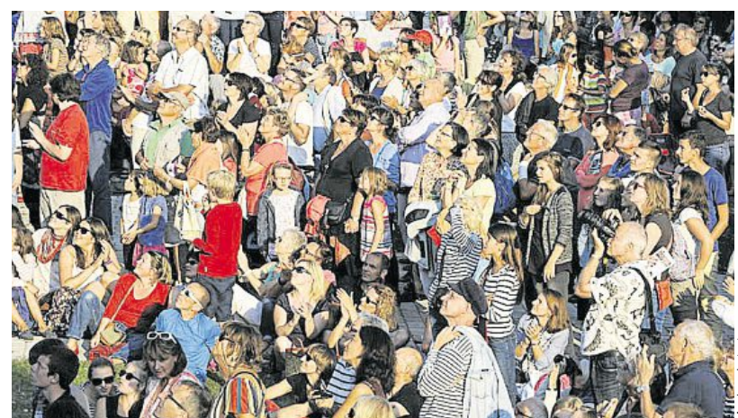
La foule au rendez-vous.