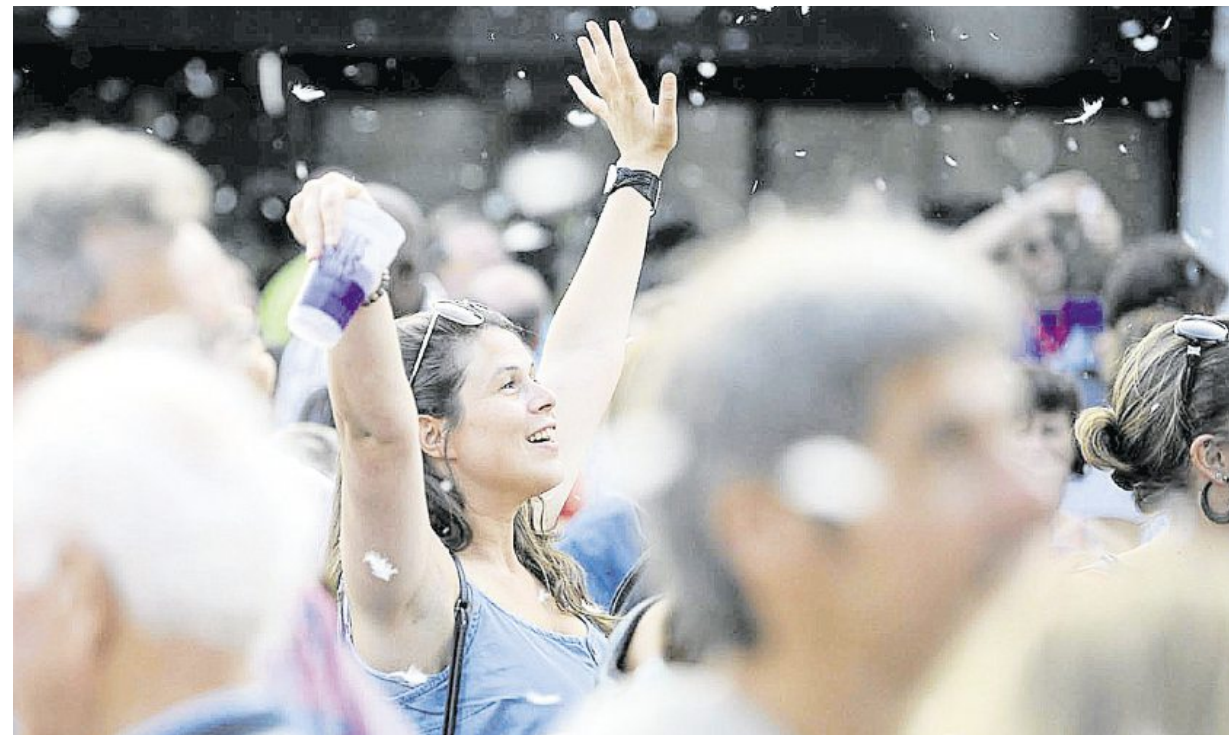
Clou du spectacle « Chimère à tous les étages » : le lancer de sac de plumes.

Ils sont venus. Ils ont joué le jeu. Par milliers, ils ont convergé dans les terres pour faire la fête au festival de théâtre de rue.