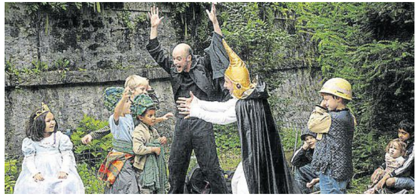
Le conte abracadabrant des Batteurs de pavés, à Guilligomarc'h.

Quimperlé. Les sites de spectacles sont référencés par numéro sur l'infographie. Jeudi 29 (et vendredi 30) : à 10 h 10, maison Saint-Joseph (1), Échappée belles - Issues de secours , par Adhok ; à 19 h 12, place Saint-Michel (2), Chorale public , par label Z et, au centre Guéhenno (3), Oba , par Jean-Marie Maddeddu et Antoine Le Ménestrel ; à 20 h 03, place Saint-Michel (2), Spring , de Pied en sol ; à 20 h 12 et à 22 h 42, parking Isole-Sainte-Croix (4), Bobby & moi , par Poc ; à 20 h 52, abbaye Sainte-Croix (5), Les tambours de feu , par Deabru Beltzak ; à 21 h 33, place Lovignon (6), Le marché d'la carcasse , par L'affaire foraine (être à l'heure sera impératif car les spectateurs sont emmenés dans un lieu secret) ; à 21 h 43, parking de l'Ellé (7), Echappées belles - Point de fuite , par Adhok ; à 21 h 43, parking Sainte-Croix, De l'autre côté , par Cirquons Flex.