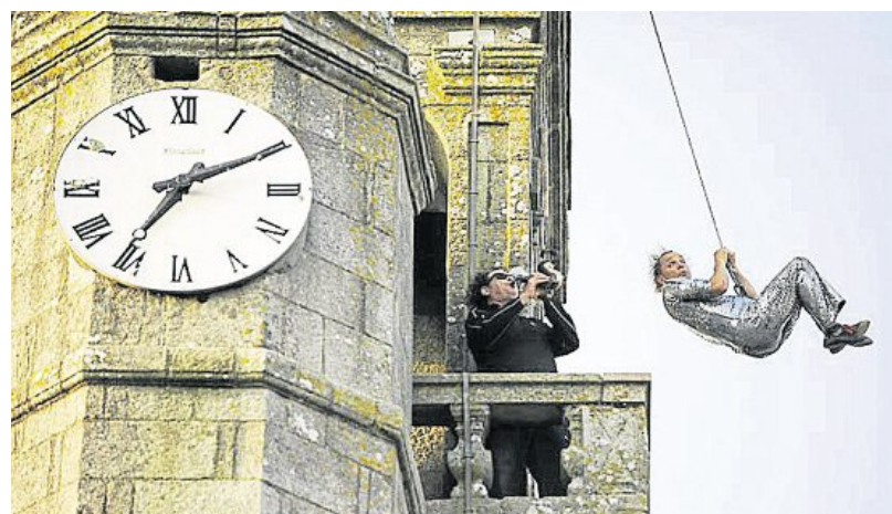
Un exercice de haute voltige.