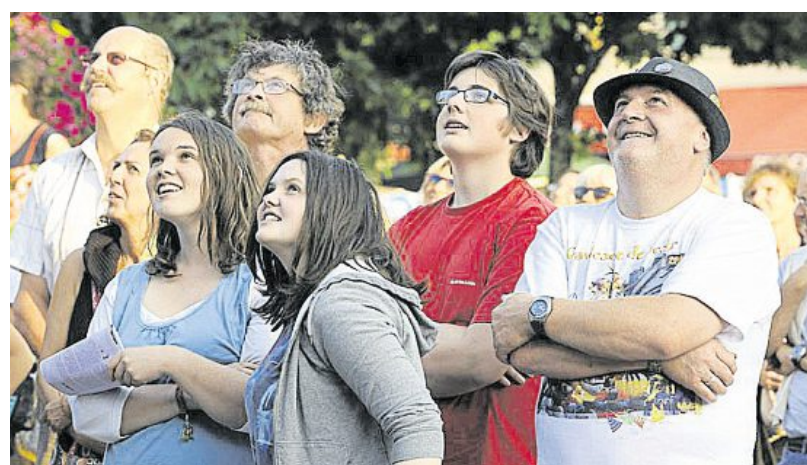
Le public admiratif devant le spectacle « La Chimère à tous les étages ».