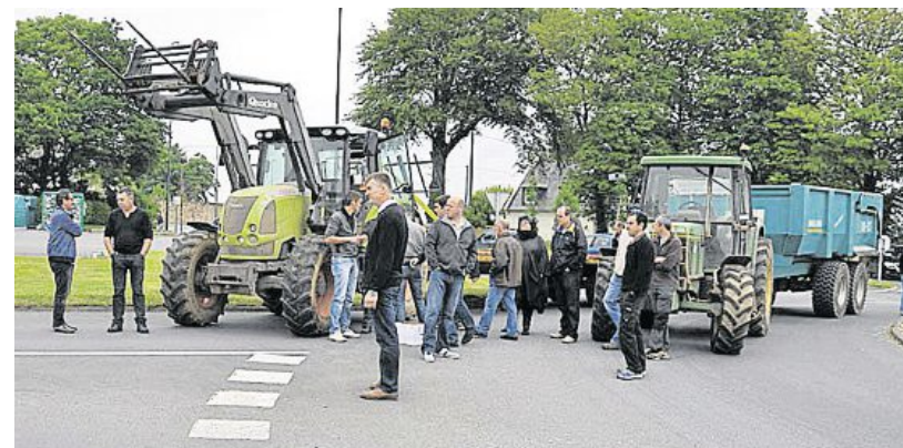
Les agriculteurs, en bloquant l'accès au Leclerc de Landerneau, dénoncent la pression de la grande distribution sur les prix d'achat aux éleveurs.

Une trentaine d'agriculteurs de la FDSEA et de Jeunes agriculteurs, aidés de trois tracteurs, ont bloqué l'accès au centre Leclerc de Landerneau, hier, à partir de 11 h 30. Les manifestants demandent un « affichage obligatoire du pays d'origine de tous les produits alimentaires et une revalorisation des prix d'achat aux éleveurs ». D'autres opérations de même type ont été menées dans