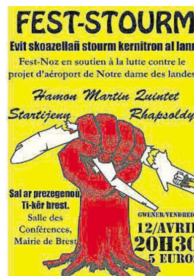
Fest-stourm le vendredi 12 avril.

Les fonds récoltés seront reversés aux organismes coordonnant les actions : l'Acipa, les collectifs de soutiens locaux, la Legalteam, les médecins de la Zad... Le public pourra confier aux organisateurs le matériel qu'il souhaite faire parvenir aux occupants de la Zad, « Zone à défendre ». Vendredi 12 avril, de 20 h 15 à 1 h,