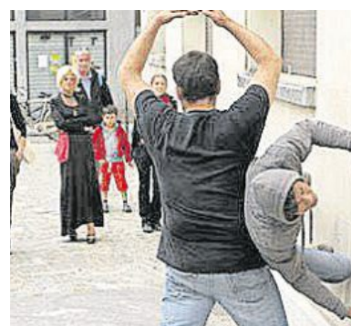
La Cie Ici Même.

fait se pencher pour rétablir le haut et le bas.