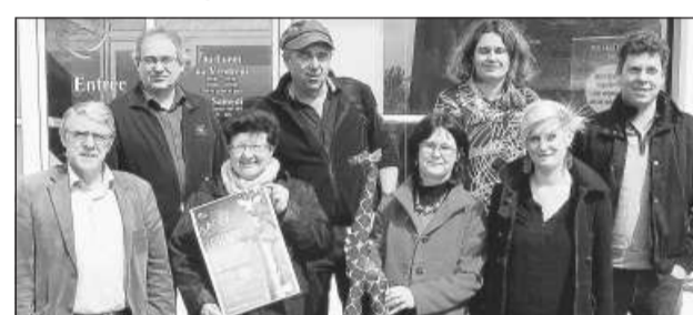
Le programme du Temps-bourg, qui se tiendra le samedi 6 juillet, a été dévoilé, mercredi matin, par les organisateurs et les différents partenaires.

Cette année, lors d'un déambulateur géant, sera présenté « Les Girafes ». Ce spectacle majestueux est une opérette animée mettant en scène neuf girafes monumentales, qui vont déambuler dans une « jungle urbaine », guidées par les voix de