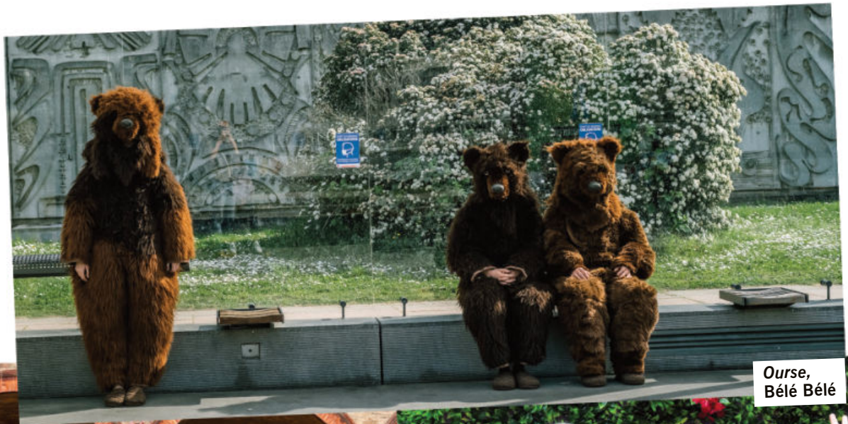
Ourse, Bélé Bélé