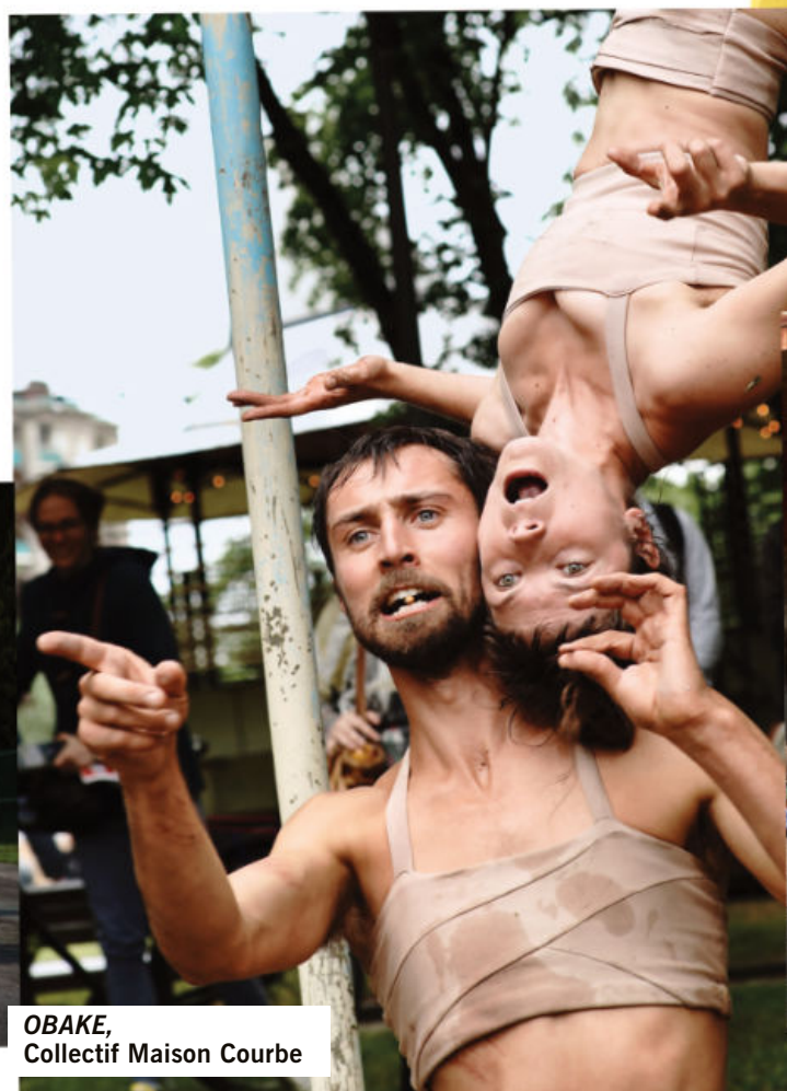
OBAKE, Collectif Maison Courbe