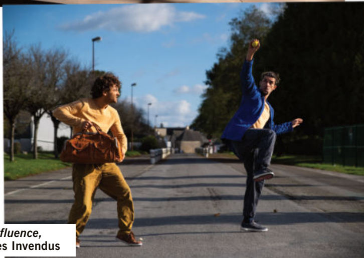
Influence, Les Invendus