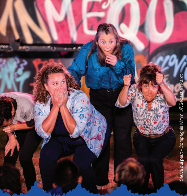
Sauve qui peut - Compagnie Mimm...