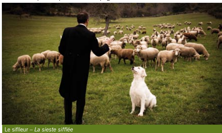
Le sifleur – La sieste sifflée

Cette année, c'est au tour de Landéda, Bourg-Blanc et Le Drennec de célébrer le retour du printemps avec 9 compagnies à l'honneur.