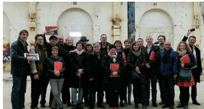
Réunion des CNARs à Brest les 7 et 8 novembre 2013, visite des Ateliers des Capucins

Le Fourneau intégrera, à l'horizon 2018, les Ateliers des Capucins dans le cadre d'une vaste opération de mutation urbaine qui vise à doter la Métropole brestoise d'un nouveau cœur de vie.